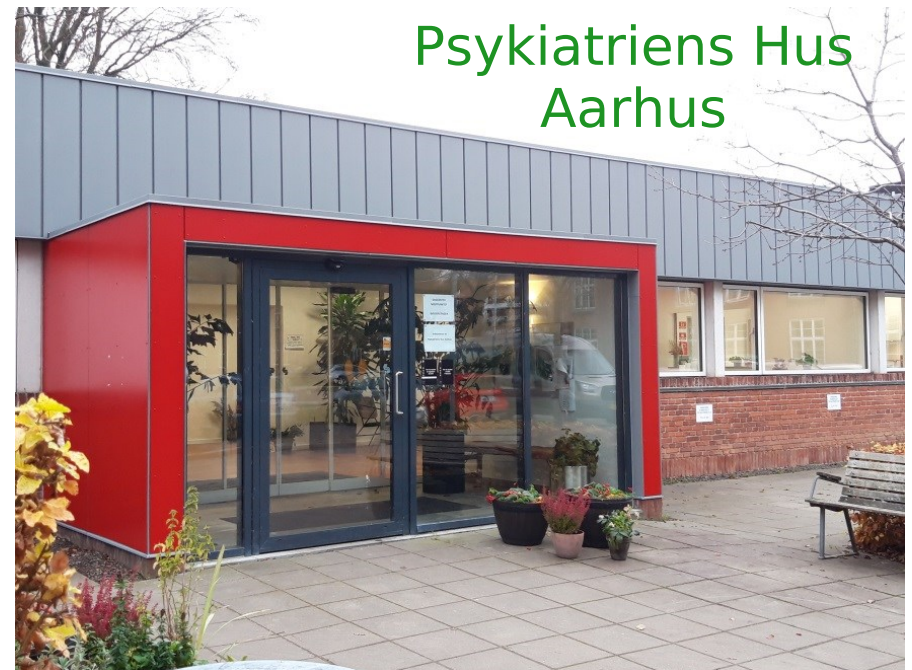
Psykiatriens Hus Aarhus